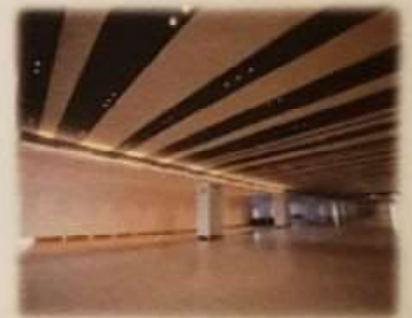
CIQ検査エリア (イベントスペース)