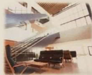
開放感のある待合ロビー